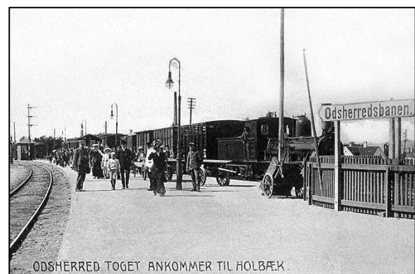
Toget fra Nykøbing Sj. er ankommet til Holbæk, ca. 1910.

I det første driftsår havde banen 144.000 passagerer, og godsmængden var 110.000 t. I dag har Odsherredsbanen 1/2-time drift i dagtimerne på hverdage og time drift om aftenen og i weekenderne. Banen havde i 2023 ca. 1,2 mio. passagerer, og rejsetiden er ca. 55 minutter.