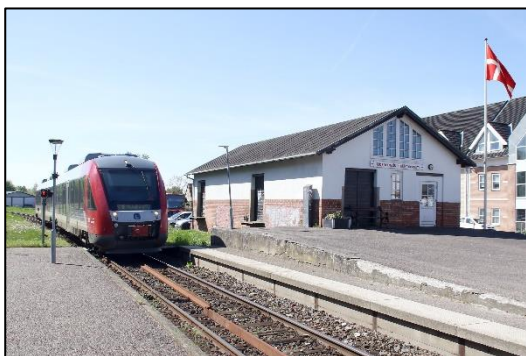
Rejs med Lokaltog til Trafikmuseet i Hørve.

Ved et besøg på Trafikmuseet kommer der altid en livlig snak om gode rejseoplevelser, f.eks. om, hvad man kan fra se fra togvinduet.