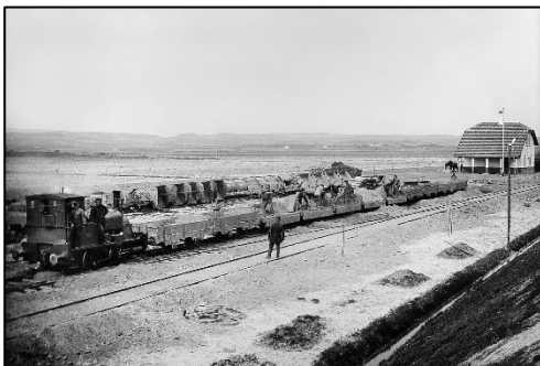
Fra anlægget af Odsherredsbanen ved Fårevejle Station, 1898.

Odsherreds Jernbane (OHJ) kan føre sin historie tilbage til 1873, samme år som udtørringen af Lammefjorden begyndte. Et konsortium fra Berlin søgte koncession til anlæg af en jernbane fra et punkt på banen mellem Roskilde og Kalundborg, åbnet i 1874, til Odsherred og Sjællands Odde.