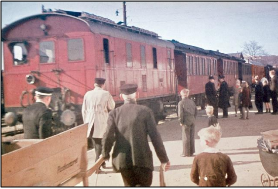
Dieseltog ankommet til Nykøbing Sj, 1944.

Odsherredsbanen, der i dag drives af Lokaltog A/S, har gennem de 125 år fulgt med tiden. De første mange år kørte togene som damptog, men fra 1920'erne og 1930'erne skiftedes til motordrift med benzindrevne motorvogne og diesellokomotiver. Efter 2. Verdenskrig anskaffedes skinnebusser. Det blev en ny epoke for banens persontrafik med de små "lyntog". Senere blev de erstattet med letbyggede dieseltog i form af Y-tog, IC2-tog og senest LINT-tog. Inden for få år vil man i forbindelse med den grønne omstilling opleve en fornyelse af togene fra dieseltog til batteritog svarende til skiftet fra dampdrift til motordrift.