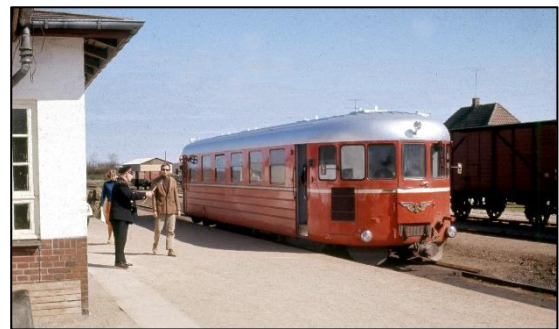
Skinnebusstog på Vig station 1966.

Takket være aflevering af billeder og effekter fra folk, privatbanerne og færgeruter samt udlån fra Dansk Jernbane-Klub m.fl. har museet meget historisk materiale, som kan ses på de skiftende udstillinger.